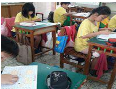
課程活動照片： 收割「信用」，快樂加「點」！