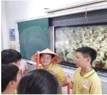
課程活動照片： 村民們質問牧童時，牧童竟然說： 我覺得很好玩啊