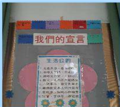
課程活動照片： 班級生活公約