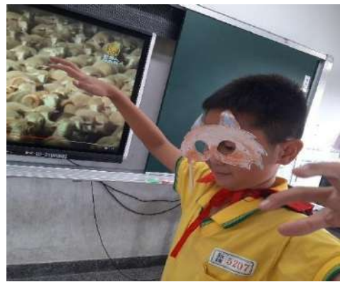
課程活動照片： 因為牧童沒信用，我的機會來了！