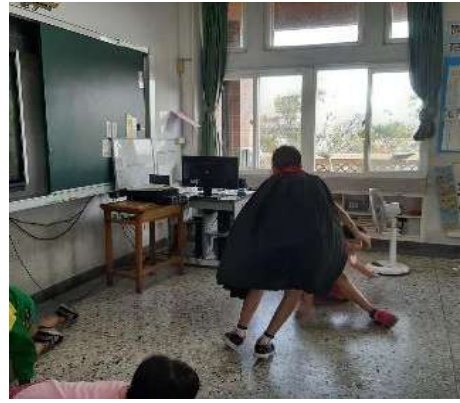
課程活動照片： 狼真的來了！