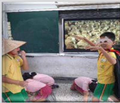
課程活動照片： 狼現身，愛說謊的牧童嚇到吃手手