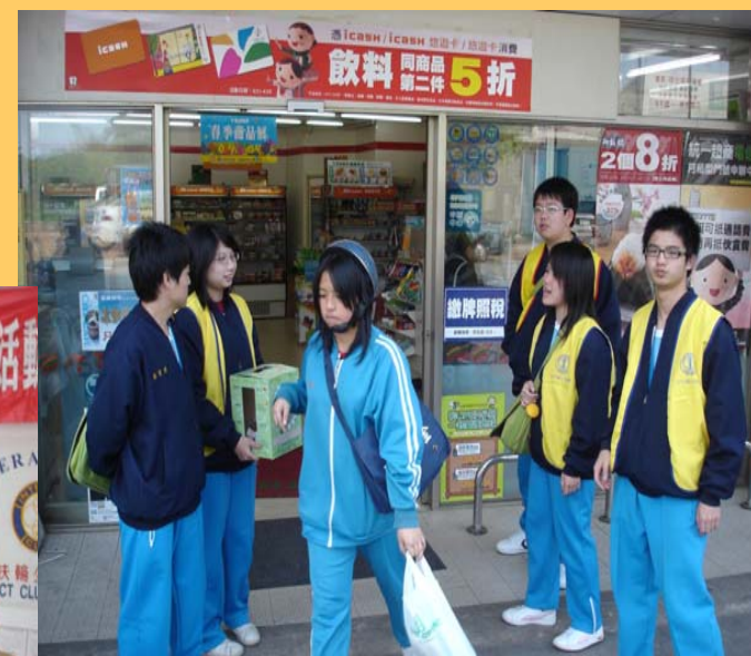
於便利商店勸募發票