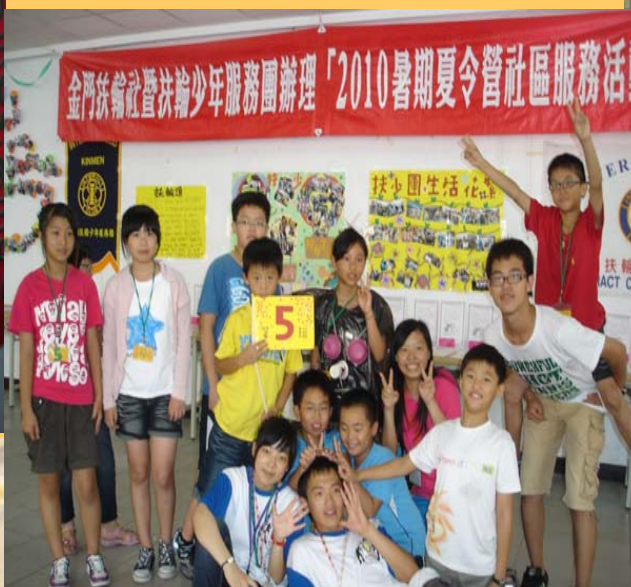
辦理國小學童暑期夏令營