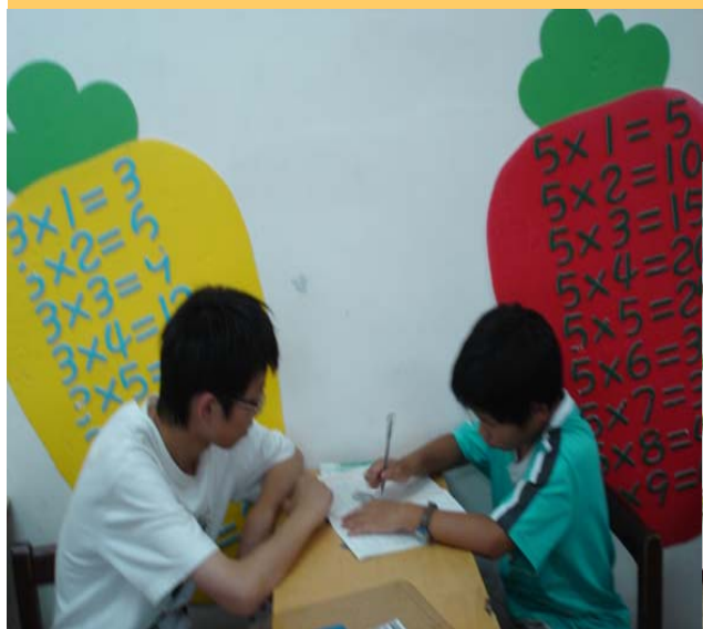
家扶中心課業輔導